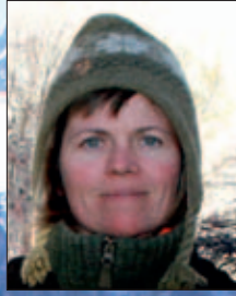
Tekst og foto Annie O. Sørensen