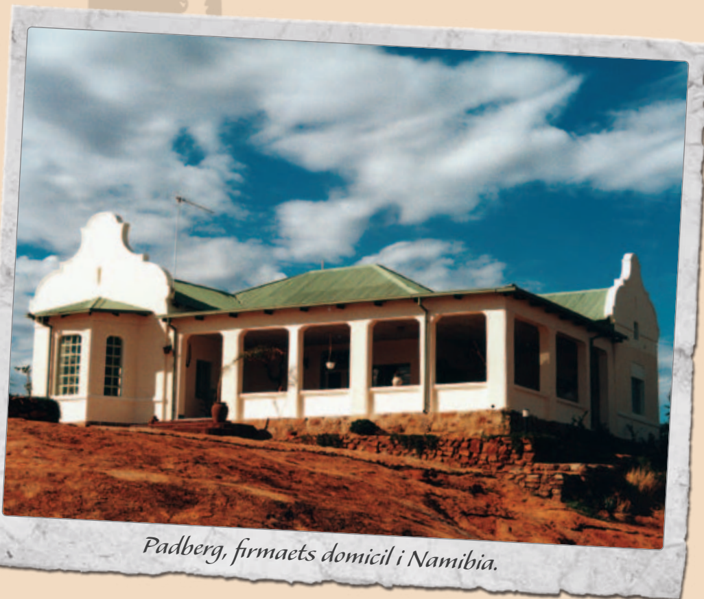
Padberg, firmaets domicil i Namibia.