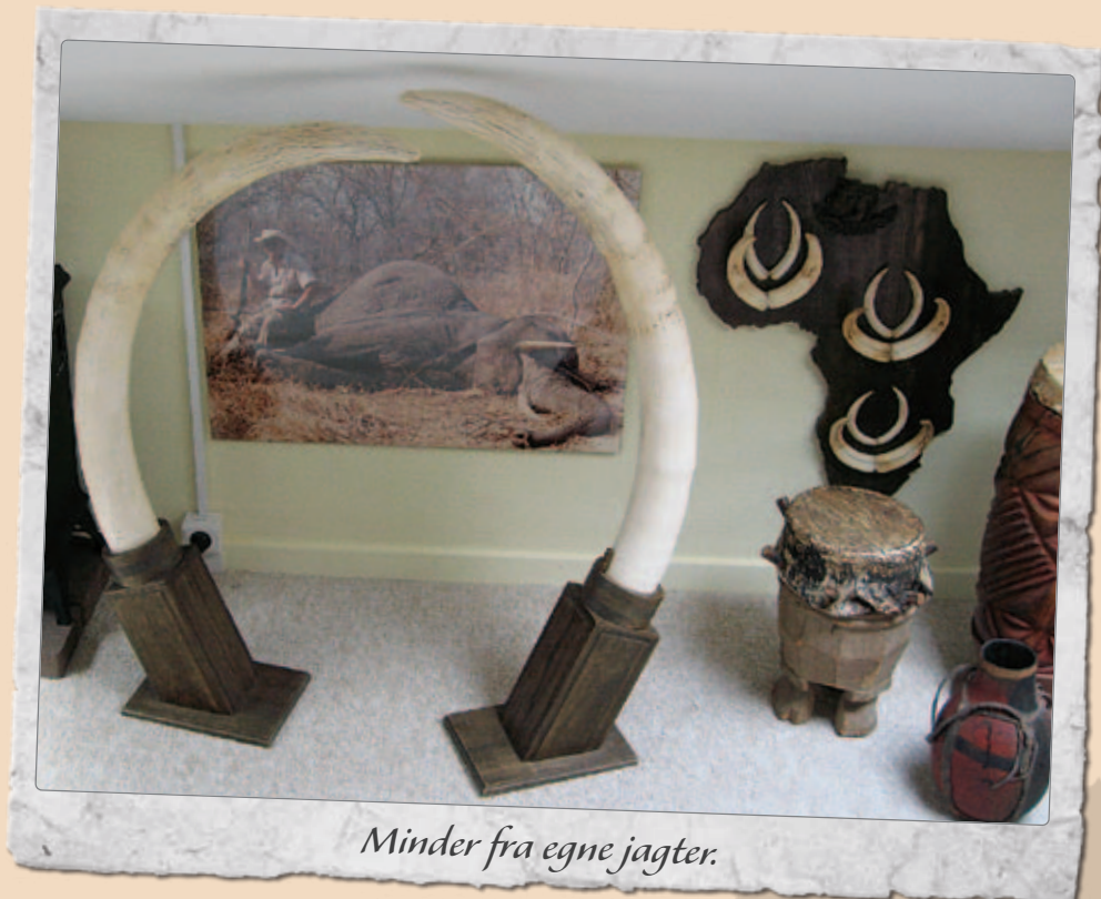
Minder fra egne jagter.

Generelt har vi med udenlandske gæster et gennemsnit på 8 skud pr. elefant. Så det var rigtig fint, at den gik ned. Men lige pludselig kom der så en elefantko og en kalv ud på arenaen. Den havde stået i bushen, uden at vi havde observeret den. Den gik hen og prøvede på at rejse den skudte tyr op med sine stødtænder«. Da hunelefanten opgav at rejse den døde elefant op, fik hun åbenbart fært af jægerne, og så tog fanden