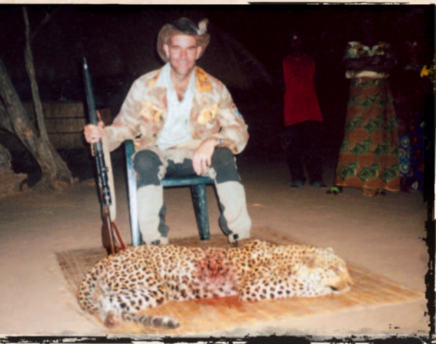
▲ 375'eren er tung medicin for en leopard.