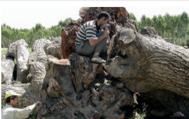
Sådan starter tilblivelsen af et stykke skæftetræ; tyrkerne bruger kun selv rodstykket fra de enorme valnøddetræer.

Lås, låsestol, pibe, magasin, håndtag til værktøj og renses tok og den fluttede pibe blev til slut sendt til Peter Zink, og alle dele blev bruneret og samlet.