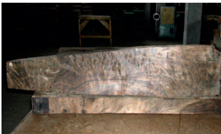
Midtjyden var selv i det østlige Tyrkiet for at hente denne otte kg tunge valnøddeklump.