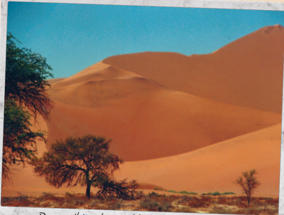
De namibianske sanddyner ved ørkenens rand.

nogle udbydere er begyndt at blive lige så kreative som flyselskaber og hoteller for at kunne tilbyde lave priser – at man så får ekstraregninger i form af kørsel mellem indkvartering og lufthavn, drinks etc., det virker meget irriterende. Jeg har jo også selv prøvet at være betalende troføjæger, og ekstraregninger af den slags kunne gøre mig rasende.