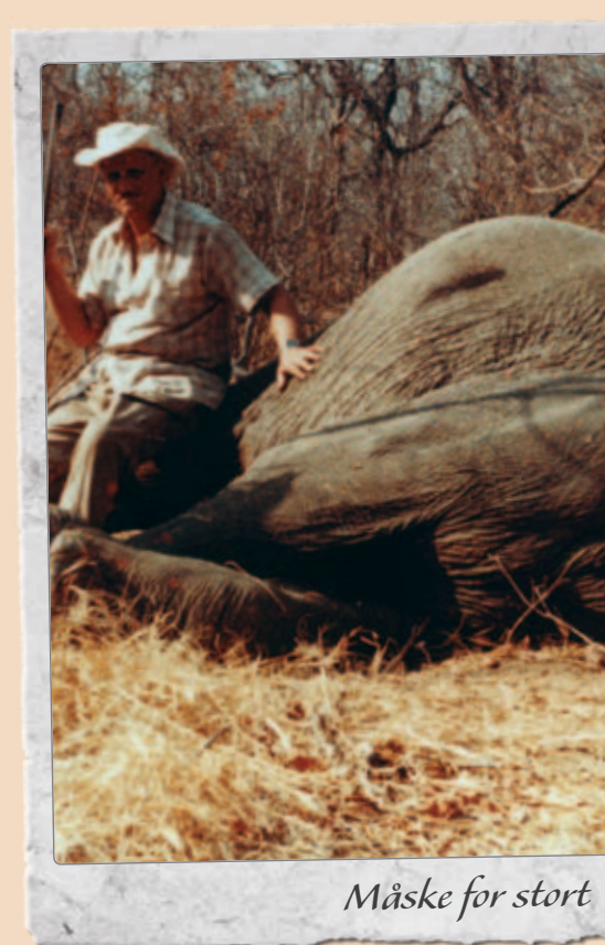
Måske for stort

yderst imødekommende. Jeg fik tilbudt logi (meget primitivt) og mad, som de sad og lavede i et hul i jorden, hvilket jeg dog ikke turde spise, så jeg levede udelukkende af Coca Cola og vilde bananer i en uge.