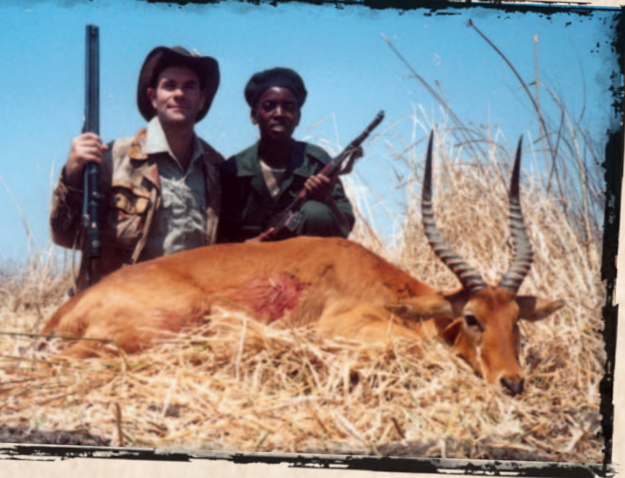
◀ Flot Puku på 19 inches.