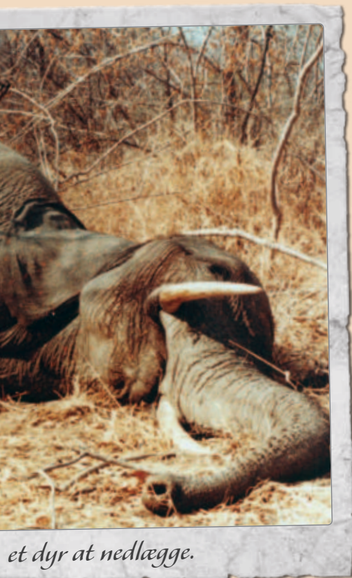
et dyr at nedlægge.

Vi havde sat som betingelse, da vi flyttede derned, at vi ville bo på en farm – ikke i en by. Det gjorde vi så også og lavede turistfaciliteter på farmen, der hed Padberg.